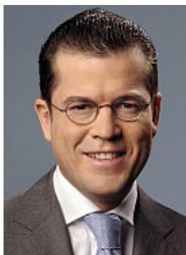
Grußwort des Bundesministers für Wirtschaft und Technologie Dr. Karl-Theodor Freiherr von und zu Guttenberg

BEREITS IM SECHSTEN JAHR prämiiert die Druck- und Medienindustrie ihre innovativsten Produkte.